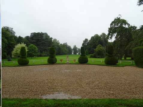
La perspective vers l'Ouest