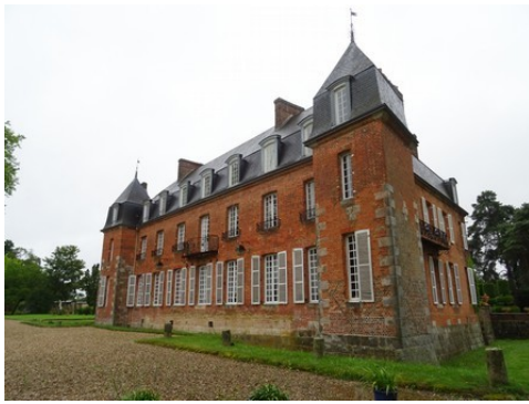
La façade ouest