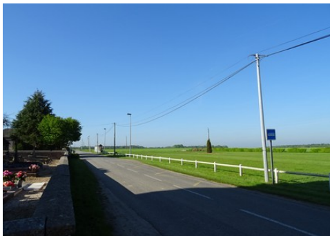
Le paysage de plaine aux alentours

Les avis seront cohérents avec ceux émis ces dernières années, à savoir : pas de maisons à volume compliqué (type V, W, Y, ou Z), pentes à 45° pour les volumes principaux, ardoise ou tuile plate de teinte brun vieilli, à 20u/m 2 , avec un débord de toiture de 20cm, enduit de teinte beige clair avec modénatures (au choix : chaînages, encadrement de fenêtres, soubassement, colombage...). *Voir les autres fiches.