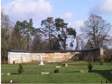
Le potager aménagé dans le parc