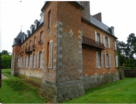
La tourelle d'angle sud-ouest (détail)