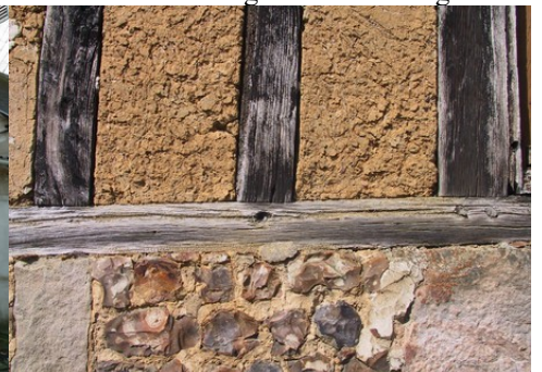
L'association de plusieurs matériaux