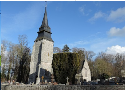
L'église de Chamblac