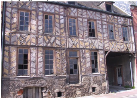
Quelques maisons de Broglie