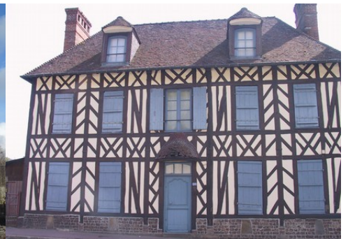
Une maison du village voisin de Broglie