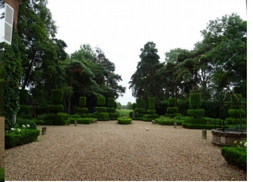
La perspective vers l'Est

Pour la zone en rose foncé dans le périmètre de 500m