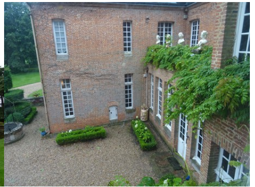
La façade est avec la galerie sur cour